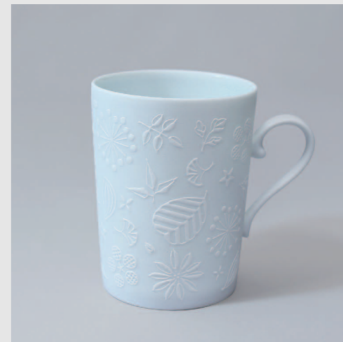
クロッシェ (fukiyose) / マグカップ100 Φ75 × H100mm W100mm 300ml 3,300円 70005F-1HML

"fukiyose" is decorated by various flowers. "sarasa" is decorated by arabesque pattern. Both products are designed by inspiration from lacework. The series name "Crocheted" is derived from crocheted lace which spread in 16th century Europe.