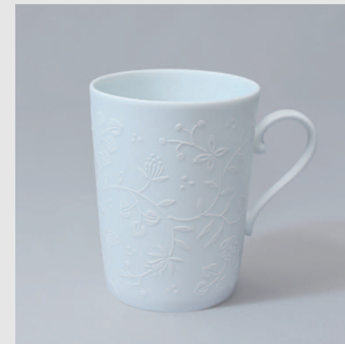
クロッシェ (sarasa) / マグカップ100 Φ75 × H100mm W100mm 300ml 3,300円 70005S-1HML